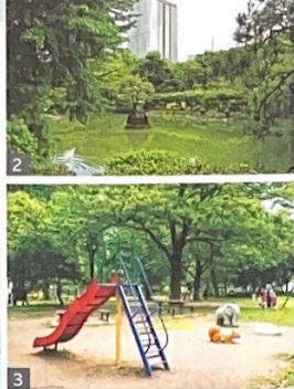
1. 公園のシンボル「大噴水」。毎日8~21時に稼働し、28分周期で24景を楽しむ 2. 鶴の噴水がシンボルとして鎮座する「雲形池」 3. 遊具やテーブルベンチが置かれた「草地広場」は、家族連れでの休息や気軽なピクニックにもおすすめ